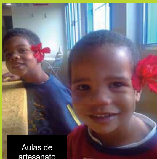
Aulas de artesanato animadas com a chegada da primavera.